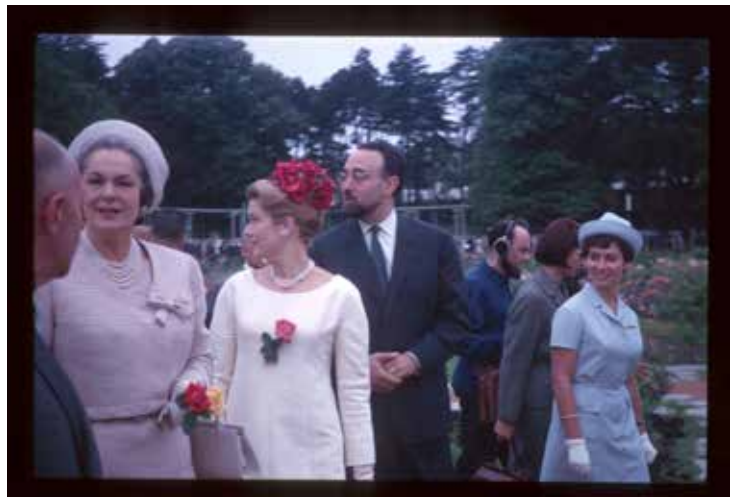
Inauguration de la Roseraie Internationale de Lyon - 1964