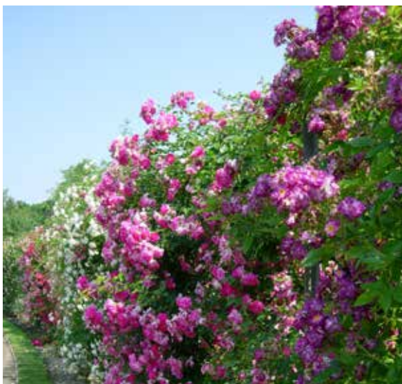
Roseraie du Jardin Botanique

Cette recherche est un véritable défi économique pour l'avenir de la rose en France, face à d'autres laboratoires internationaux aux USA, en Australie, au Japon, au Pays-Bas et en Israël. Quoi qu'il en soit, la rose du XXI ème siècle sera probablement plus robuste, plus résistante aux maladies, plus florifère et surtout... plus parfumée !