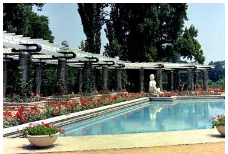
Bassin roseraie parc de la Tête d 'Or

Progressivement, la culture de la rose va s'imposer dans toute la cité.