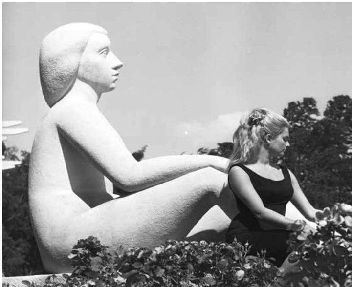
la roseraie sert de décor pour les séances photos

En 1849, JB Guillot fils, met au point une greffe qui va révolutionner la culture du rosier. Il crée la rose 'La France', première fleur de la famille des hybrides de thé (croisement entre des variétés européennes et chinoises) commercialisée : de couleur rose vif à l'extérieur et argentée à l'intérieur, elle ouvre la voie aux roses modernes, colorées et surprenantes.