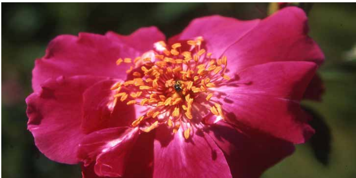
'Gloire des Rosomanes' - Plantier