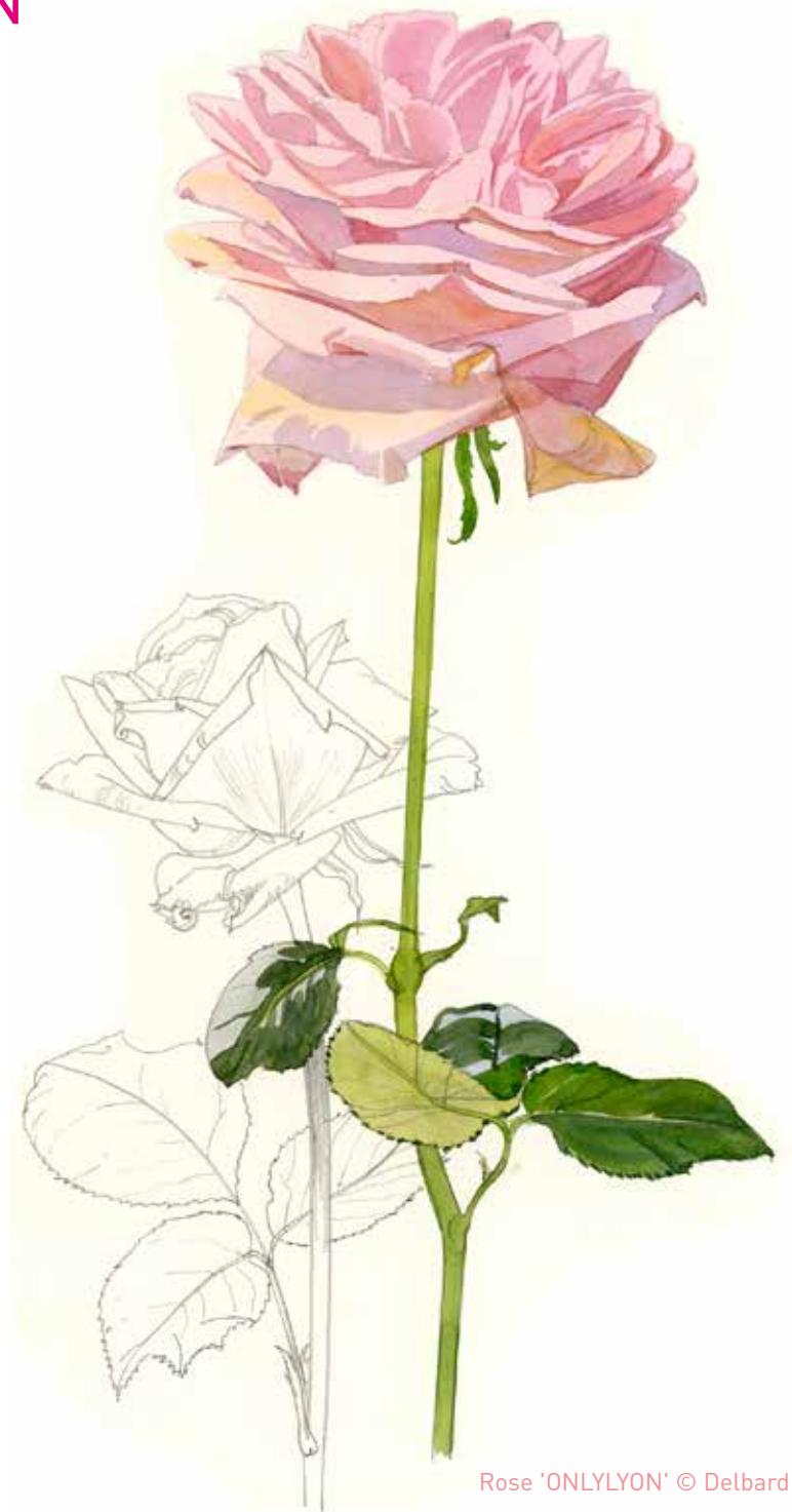
Rose 'ONLYLYON' © Delbard

Le baptême d'une nouvelle rose 'Belle de Gadagne' choisie par le public parmi 4 créations lyonnaises sera également organisé pendant le Festival mondial des roses.