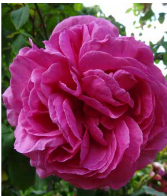
Rose 'Madame Isaac Pereire' - Bourbon

Ces créateurs de roses sont de véritables artistes, qui allient gestes techniques, patience, intuition et même connaissances génétiques, pour sélectionner de nouvelles variétés inédites et sublimes qui viendront enrichir nos roseraies du XXI ème siècle. Cette recherche de l'excellence est aujourd'hui soutenue et relayée par les études scientifiques menées au sein des laboratoires lyonnais.