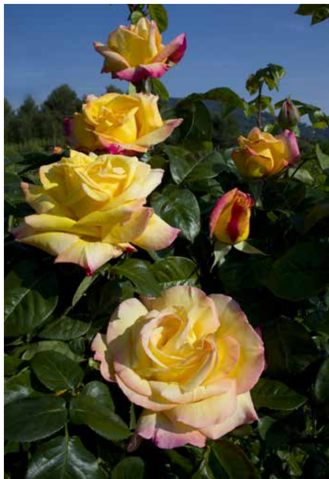
Rose 'Peace' - Meiland

■ LES CENTRES COMMERCIAUX, Galeries Lafayette, centre commercial de la Part-Dieu et Confluence s'associent également à l'événement en proposant des animations autour de la rose.