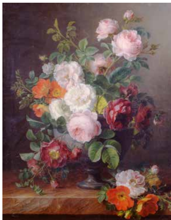
Vase de Roses, Cornelis Van Spaendonck 1855, Musée des Beaux-Arts de Lyon

Le « Salon des fleurs » réunit des tableaux de quelques-uns des plus grands maîtres de la fleur à la fin du XVIII ème siècle (Van Spaendonck, Van Dael,...) autour d'Antoine Berjon (Fruits et fleurs dans une corbeille d'osier), spécialiste lyonnais du genre, qui connaît une fortune particulière à Lyon en rapport avec l'industrie soyeuse, friande de modèles naturels.