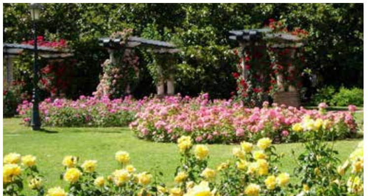
Grande roseraie du parc de la Tête d'Or

Aujourd'hui encore 50% des obtenteurs européens (les créateurs de nouvelles roses) sont lyonnais et les roseraies et jardins lyonnais riches de plus de 30 000 roses, sont à la fois, des conservatoires de roses anciennes et des espaces de découverte des roses modernes. Ce précieux passé va refleurir sous de multiples formes en ce printemps 2015 à Lyon. La ville accueille cette année et pour la première fois en France, le rendez-vous incontournable des passionnés de roses, le Congrès mondial des Sociétés de Roses qui réunira pendant 4 jours, 600 congressistes du monde entier du 25 mai au 1 er juin.