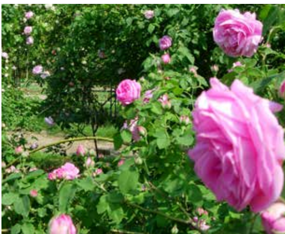
Roseraie du Jardin Botanique