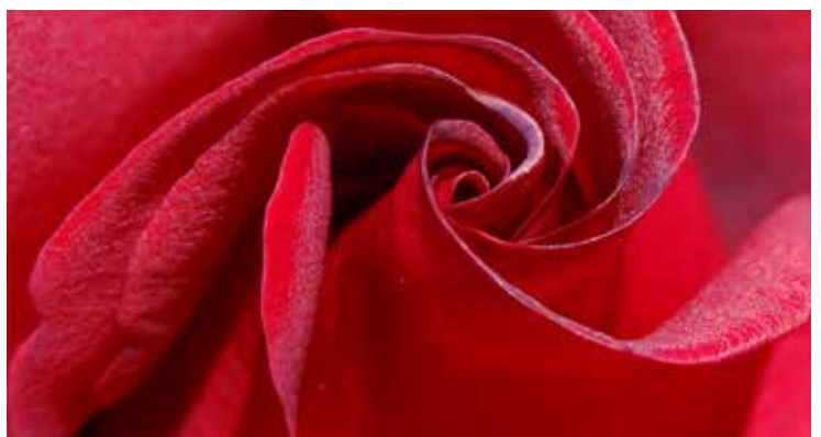
Black Magic - Tantau