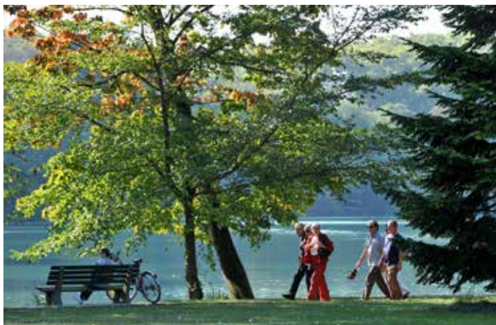
Parc de la Tête d'Or

Depuis plus de 10 ans, la Ville de Lyon mène une politique dynamique et volontaire de reconquête des espaces urbains afin d'assurer le meilleur cadre de vie aux habitants, tout en préservant ou en créant de nouveaux espaces naturels. Grâce à la requalification de friches en parcs et jardins, mais aussi à la réalisation de grands projets comme les berges du Rhône, la Confluence, les rives de Saône et de nombreux aménagements verts, c'est une nouvelle trame verte qui habille la ville.