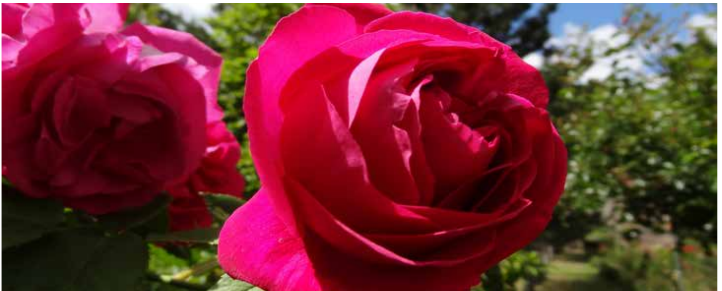
Rose 'Baron JB Gonella' - Bourbon

Pour les producteurs et obtenteurs, la tenue d'un événement professionnel à Lyon est une consécration. C'est la reconnaissance de tout ce qu'ils ont pu apporter à la recherche et à la création des roses depuis plusieurs générations. Ce sera aussi l'occasion de prouver leur expertise et de présenter leurs toutes dernières créations.