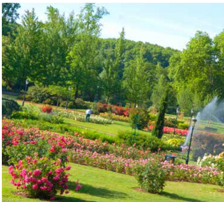
Grande Roseraie du parc de la Tête d'Or

L'actualité génomique du rosier, ses résultats et ses perspectives seront au cœur des échanges. Six conférences et deux ateliers seront organisés pour les 200 participants français et étrangers, parmi lesquels de nombreux chercheurs, agronomes et obtenteurs.