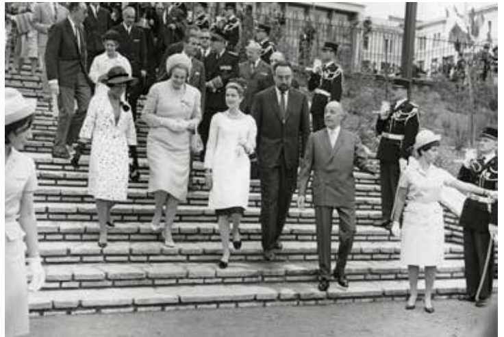
Inauguration de la Roseraie Internationale de Lyon - 1964

Des visites olfactives et des parcours originaux seront aussi proposés par le Musée des Beaux-Arts . Les 30 et 31 mai des bouquets historiques inspirés d'œuvres du musée seront présentés.