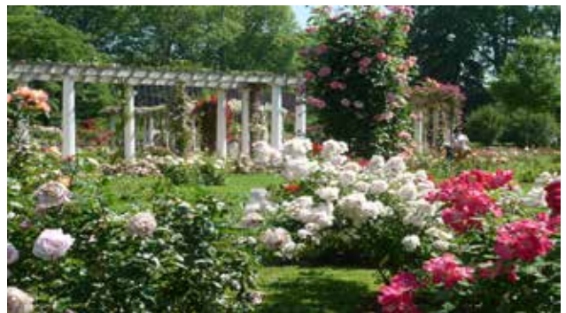
Roseraie de concours