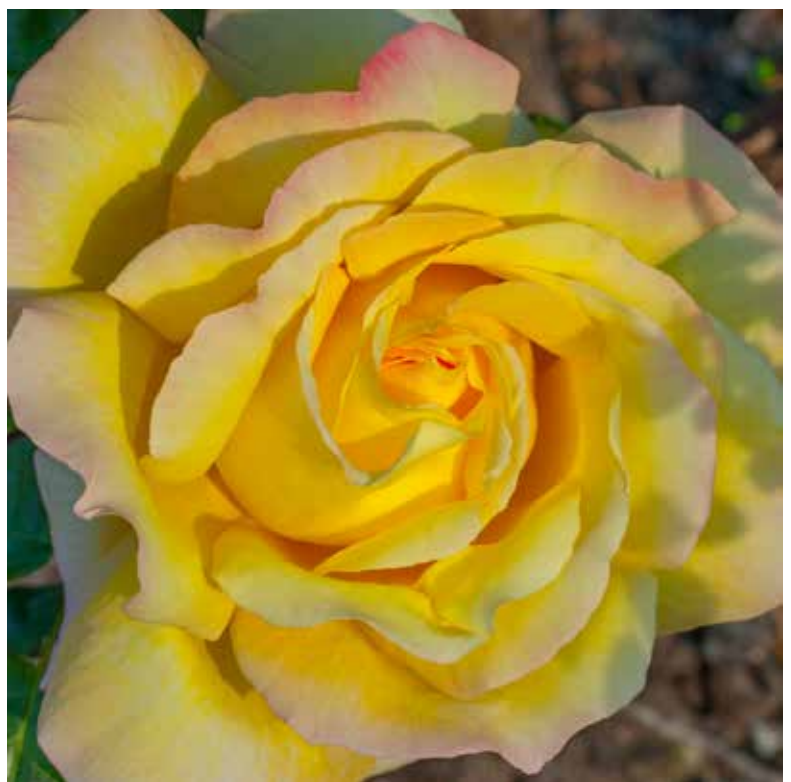
Rose 'Peace' - Meilland