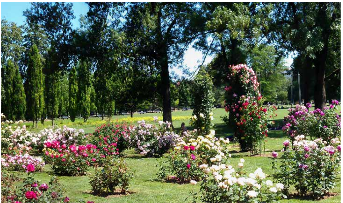
Grande roseraie du parc de la Tête d'Or

Le point d'orgue du festival aura lieu les 29, 30 et 31 mai en centre-ville de Lyon dans trois lieux emblématiques, et au parc de la Tête d'Or, avec un week-end d'animations dédié à la rose.