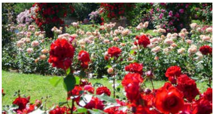
Grande roseraie du parc de la Tête d'Or